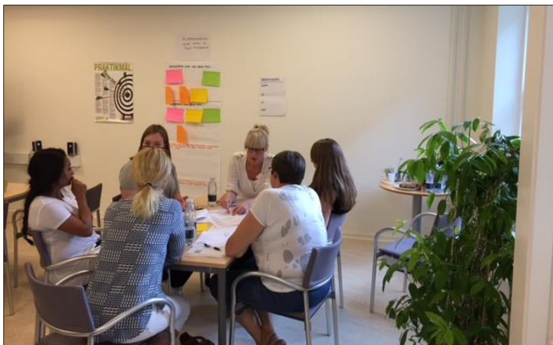
Evalueringsdag på SOPU 2. september 2016