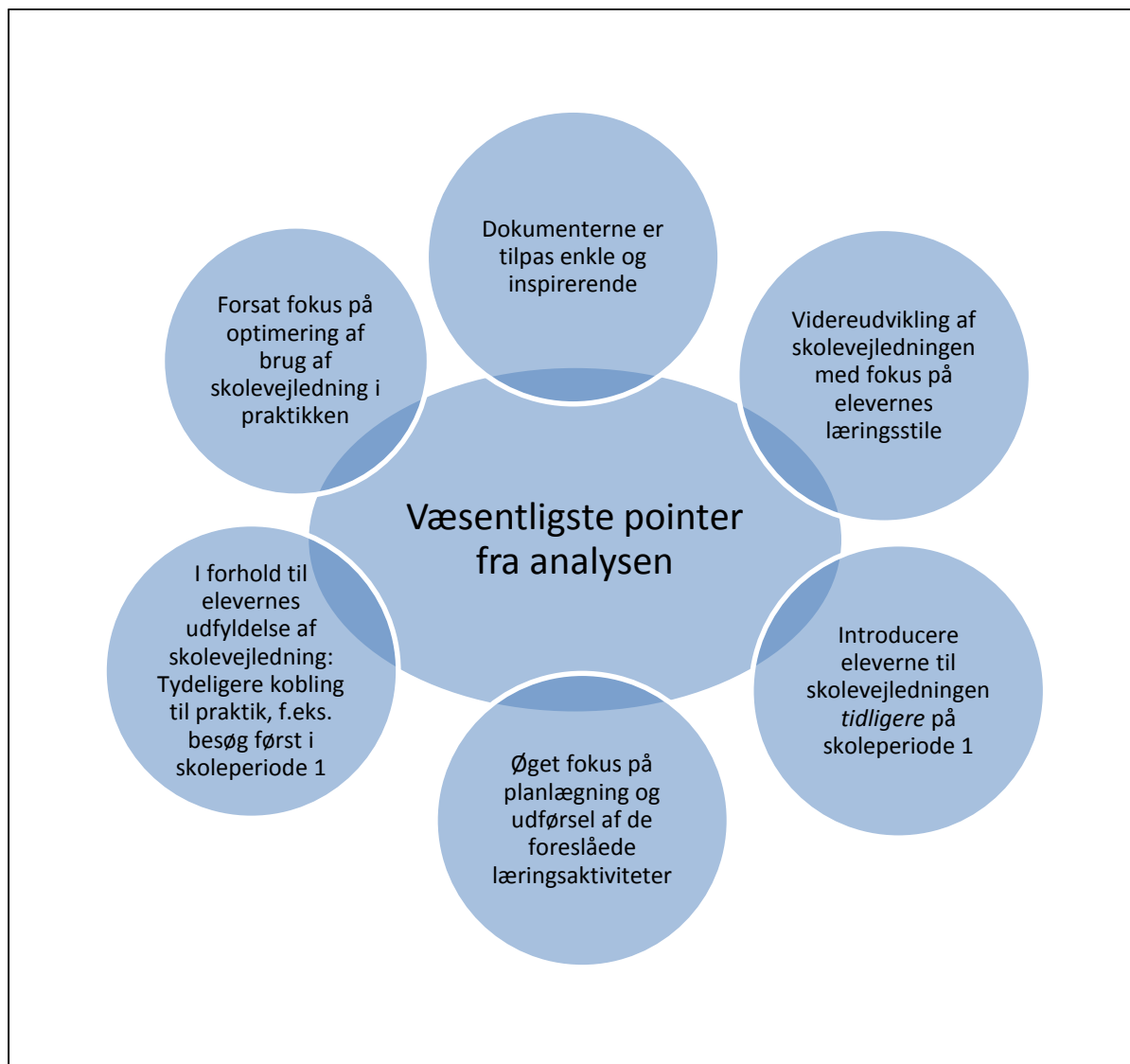
Figur 1. Væsentlige pointer i analysen

billede af, hvad praktikken er. Endvidere er det væsentligt, at der i underviser-teamene og i skoleforløbet afsættes tid til planlægning og gennemførelse af læringsaktiviteter i forbindelse med både skolevejledning og praktikerklæring/hjælpekema. Der er forslag til læringsaktiviteter i dokumenterne.